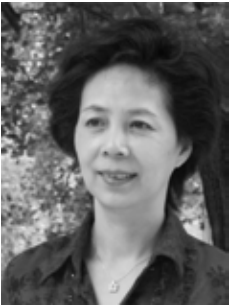
范小青（ファン・シオチン）

1953年、中国河南省許昌生まれ。文革期に農村で労働、後に工場労働者、文化局勤務、雑誌編集などを担当。1978年から長編小説、短篇小説、ルポルタージュ、テレビ脚本などの作品を多数発表してきた。現在、河南省文学芸術界連合会副主席、河南省作家協会主席。日本語に翻訳されている著作「羊の門」（勉誠出版）