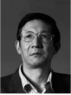
李佩甫（リー・ペイフー）

1953年、中国河南省許昌生まれ。文革期に農村で労働、後に工場労働者、文化局勤務、雑誌編集などを担当。1978年から長編小説、短篇小説、ルポルタージュ、テレビ脚本などの作品を多数発表してきた。現在、河南省文学芸術界連合会副主席、河南省作家協会主席。日本語に翻訳されている著作「羊の門」（勉誠出版）